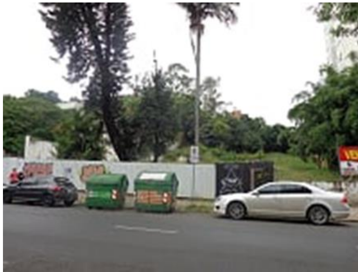
Imagem 01 – Vista frontal do imóvel.

Obra localizada na Rua Domingos Martins, Município de Canoas – RS;