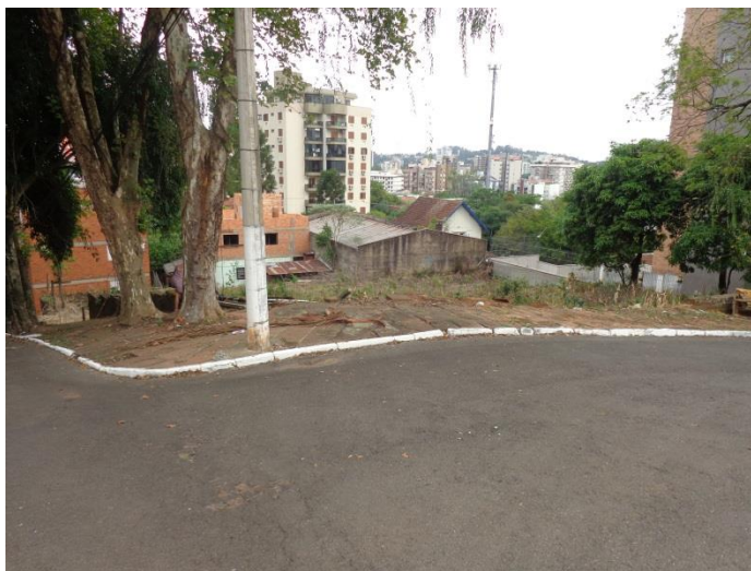
Imagem 01 – Vista frontal do imóvel.

Obra localizada na Rua Vidal Negreiros Esquina com a Rua Raimundo Corrêa, Nova Hamburgo – RS.