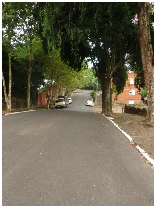
Imagens 02 e 03 – Rua Vidal de Negreiros e Rua Raimundo Corrêa confrontantes com o Condomínio Residencial Vidal e Negreiros.